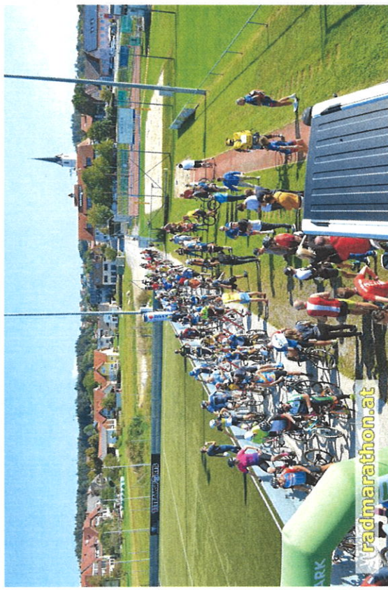
Start zum 24h-Rennen bei perfekten Wetterbedingungen

Bei bereits üblichem Kaiserwetter wurde bei der 16. bioenergie+ 2/6/12/24h Radtrophie - Rund um die Kirschenhalle das 24h Rennen Samstag um 10:30 gestartet. Insgesamt etwas mehr als 200 Radsportler aus 5 Nationen nutzten von 4.-5.9.2021 die Chance, beim ältesten österreichischen 24h Radevent dabei zu sein.