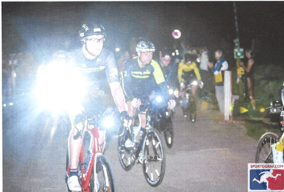
Schnelles Rennen auf einem Rundkurs mit technisch interessanten Passagen

Das 24h Rad-Finale von 4. - 5. September 2021 in Hitzendorf bei Graz. Neben dem 24h-Bewerb für Solo und Teams stehen 12h, 6h und der neu geschaffene 2 Stunden Bewerb für Youngstars am Programm. Das Teilnehmerlimit beträgt insgesamt 250 Startplätze.